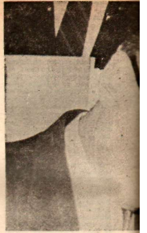
Eski Amerikan Şirketin