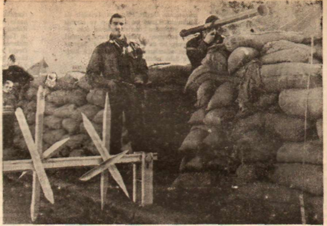
Türk mücahitleri silâh elde bekliyorlar

ISMET KOTAK Zafer Gazetesi Sahip ve yazarlarından - Kıbrıs