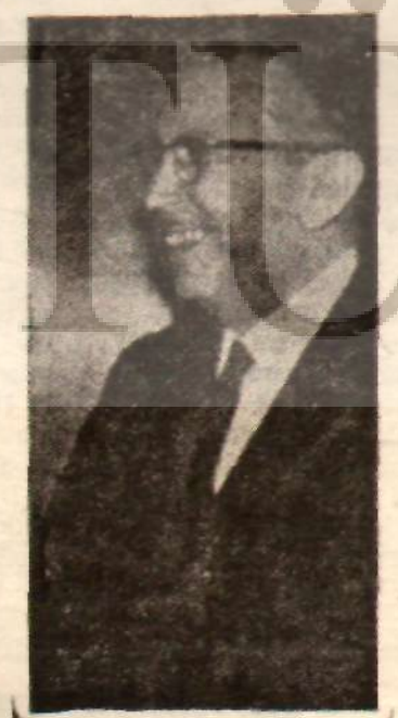
İhsan Sabri Çağlayangil Usta geribetçi...